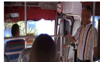
Aumenta tarifa del transporte público en Barranquilla