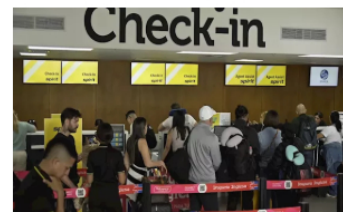
Se registra una gran afluencia de viajeros este lunes en el Atlántico por celebración de fin de año