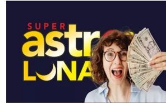
Resultado de Súper Astro Luna: sorteo hoy 29 de diciembre de 2024