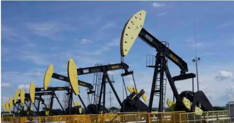
Ecopetrol, Petrolero, Colombia

Ecopetrol se convierte en el dueño total del bloque petrolero CPO-09 en el departamento del Meta, tras adquirir el 45% restante que poseía Repsol. La adquisición permitirá aumentar las reservas y la producción de petróleo.