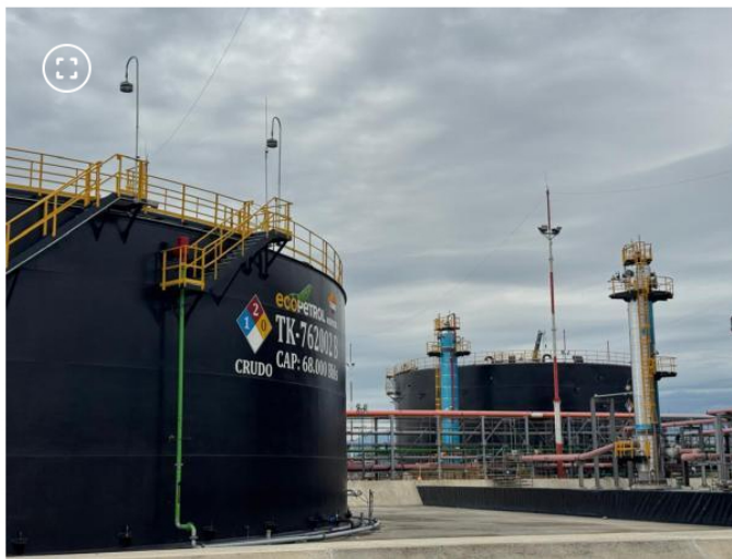
Facilidades de producción del bloque CPO-9

Ecopetrol compró la participación del 45% de Repsol en el bloque CPO 09