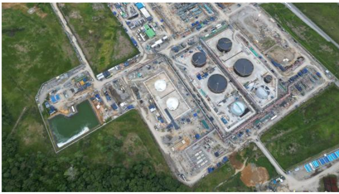
Facilidades de producción del bloque CPO-9

Sin embargo, en la tarde de este domingo se conoció que Ecopetrol le ganó el pulso a GeoPark y se quedó con ese 45 por ciento del bloque CPO-9 , convirtiéndose en el propietario del 100 por ciento de este activo estratégico en el Piedemonte Llanero.