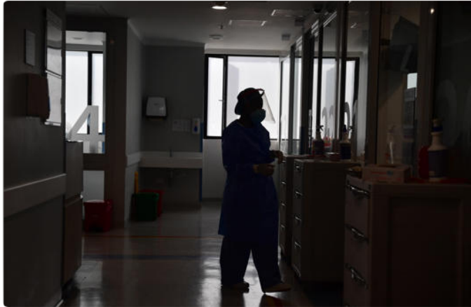
La decisión final de adoptar el instrumento corresponderá a los países miembros de la OMS.

A pesar de estos llamados a la acción y de la creciente preocupación entre los científicos por virus como el de la gripe aviar, los países no han logrado concretar exitosamente las negociaciones de un acuerdo pandémico global que brinde una respuesta coordinada y eficaz ante futuras amenazas sanitarias.