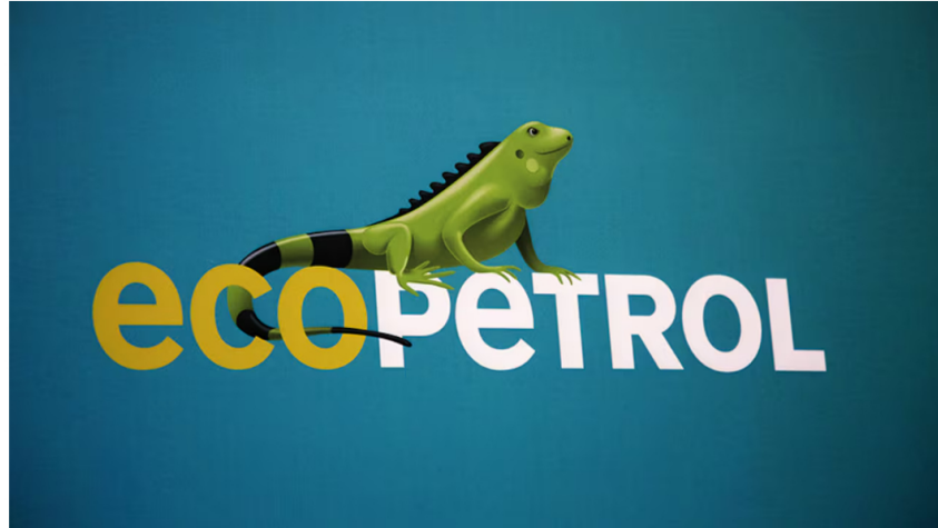
La principal empresa petrolera de Colombia realizó el anuncio de la transacción durante la Jornada de este domingo 29 de diciembre de 2024.

29 de diciembre de 2024 Por: Redacción El País