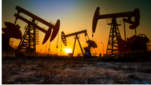
Colombia realizó un viraje en su política petrolera en detrimento de la exploración de nuevos pozos.

Un informe publicado por el grupo de investigadores de CitiGroup acerca de las perspectivas del sector petrolero y gasífero en América Latina , identificó que Ecopetrol debería sortear una serie de desafíos para continuar vigente en el mercado latinoamericano en cuanto al número de barriles de petróleo procesados.