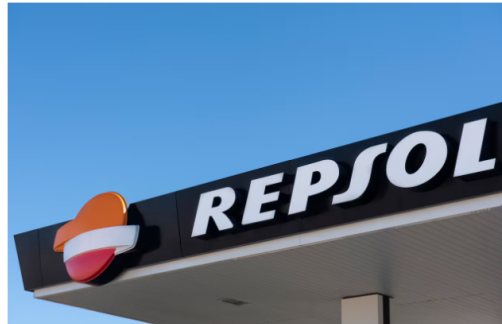
Ecopetrol anunció la compra de la participación de Repsol en un bloque petrolero ubicado en el departamento del Meta.

Según se ha podido conocer, se trataría del bloque conocido como CPO-09, el cual se extiende a lo largo de los municipios de Granada, El Dorado, El Castillo, Acacias, Castilla La Nueva, San Martín, Lejanías y Villavicencio.