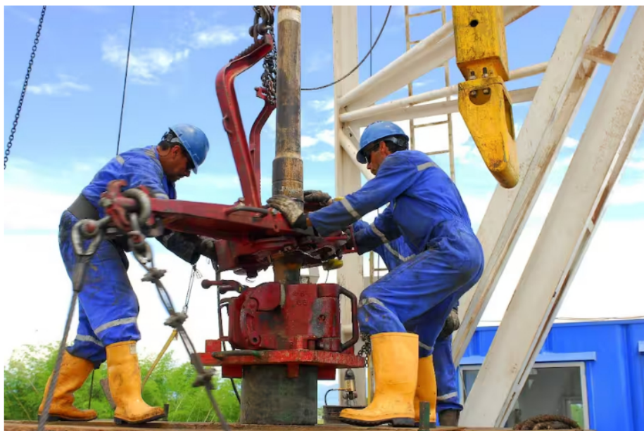
Ecopetrol anunció importante negocio con la multinacional Repsol.