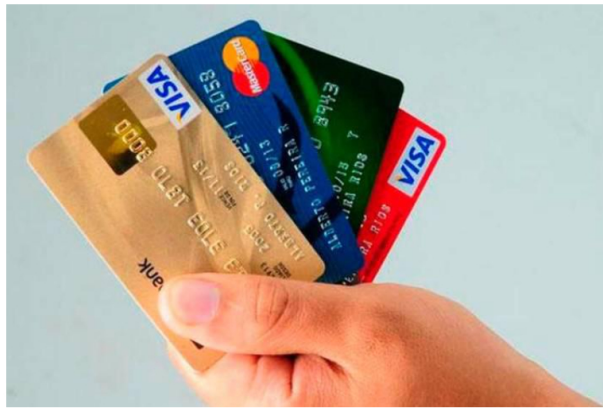
Tasa de usura en Colombia baja a 24,89% en enero.

La tasa de usura, que define el interés máximo en créditos, baja a su nivel más bajo desde 2011: una gran noticia para consumidores.