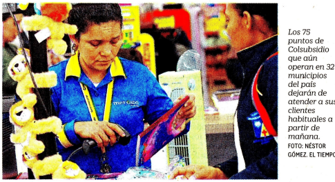
Los 75 puntos de Colsubsidio que aún operan en 32 municipios del país dejarán de atender a sus clientes habituales a partir de mañana.