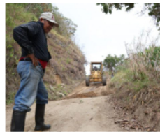
26 diciembre, 2024 Un año de trabajo en equipo en beneficio de las comunidades riverenses