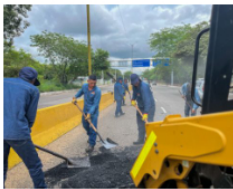
27 diciembre, 2024 En un día se taparon más de 130 huecos en Neiva