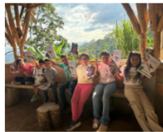
27 diciembre, 2024 Elegidos los mejores Proyectos Ciudadanos de Educación Ambiental 2024