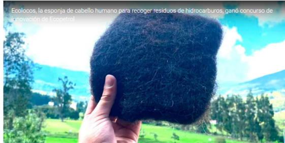
Ecococos, la esponja de cabello humano para recoger residuos de hidrocarburos, ganó concurso de innovación de Ecopetrol