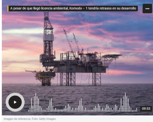
Imagen de referencia.

Amylkar Acosta, exministro de Minas y Energía, aseguró que la plataforma que se necesita para desarrollar los trabajos en el pozo gasífero Komodo – 1 ya se fue del país y volverla a traer tardaría un par de años