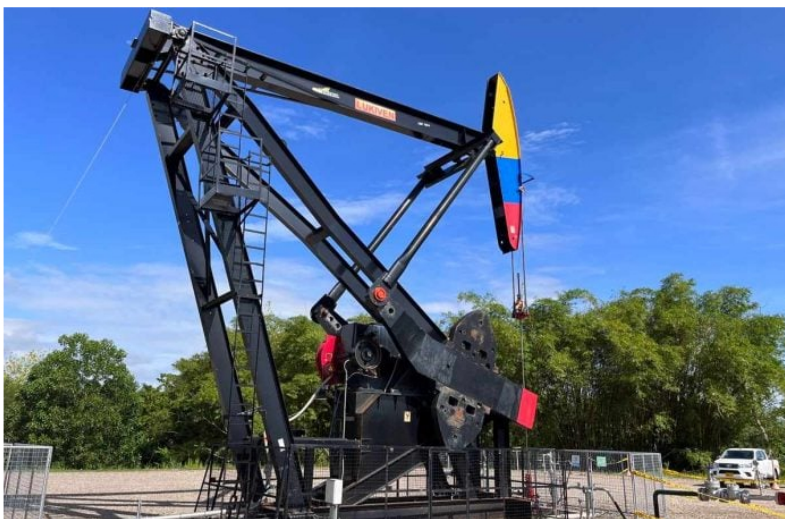
Producción de petróleo en Colombia cayó 2,4% en octubre de 2024.

El más reciente balance de Campetrol reveló que, en octubre de 2024, la fiscalizada producción de petróleo en Colombia alcanzó los 764,5 mil barriles por día (KBPD), reflejando una disminución de 2,4 % frente al mismo periodo del año anterior, equivalente a 18,5 KBPD menos.