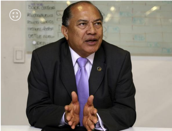
Exministro de Minas y Energía, Amylkar Acosta.

Camacol estima que 40.500 hogares se quedan sin cobertura por suspensión de ‘Mi Casa Ya’