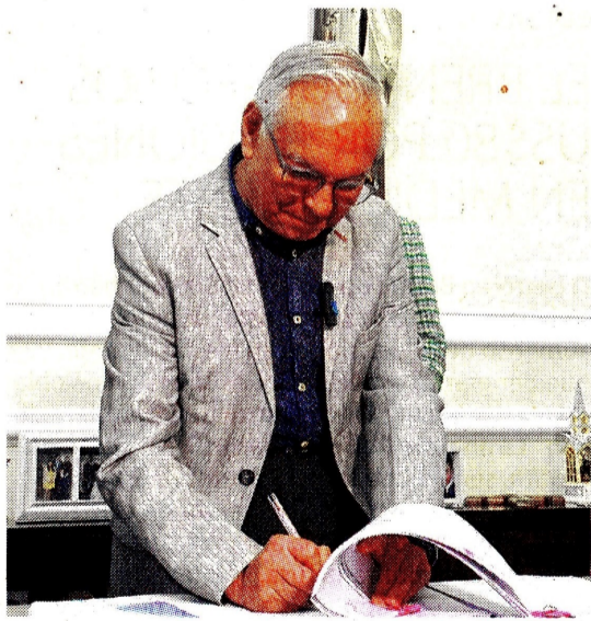
Ministerio de Hacienda