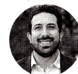
Diego Alejandro Guevara Ministro (e) de Hacienda

El lunes 16 de diciembre, la ministra de Transporte , María Constanza García , anunció que a partir del 1 de enero de 2025 los peajes tendrán un incremento de 4,64%, con un ajuste adicional previsto para el mismo mes que elevará el aumento total a 10%. El Gobierno, en un intento por contener el aumento del costo de vida que alcanzó 13,2%, optó por congelar las tarifas de los peajes. Sin embargo, esta decisión provocó un desbalance fiscal. La ministra García destacó que el Gobierno asignó una partida adicional de $500.000 millones al presupuesto de la ANI para compensar los costos generados por el congelamiento.