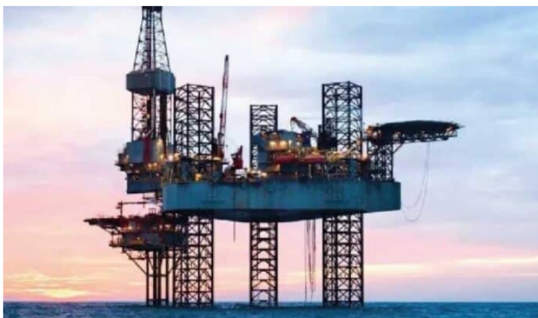
Ecopetrol avanza en los proyectos de Komodo 1.

La Autoridad Nacional de Licencias Ambientales (ANLA) dió la licencia ambiental para el proyecto conocido como Komodo -1 , una perforación exploratoria de hidrocarburos en aguas ultra profundas del Caribe colombiano , así lo informó Caracol Radio.