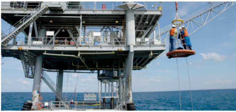
Plataforma Chuchupa en Colombia.

Entre los responsables, el sindicato señala al gobierno de Iván Duque, de quien expresa que en 2021, para cubrir el déficit fiscal, usó la empresa como una fuente de financiamiento e hizo aprobar por parte de la junta directiva de Ecopetrol , la compra del 51.4% de la empresa de interconexión eléctrica ISA, que también era propiedad del Estado.