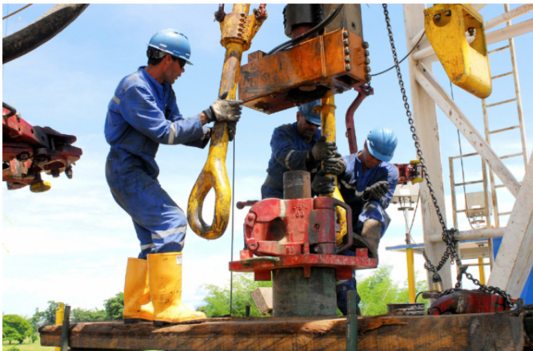
Trabajadores de campo de producción en Apiay, en Meta.

Por malos negocios, la empresa más importante de los colombianos, la estatal petrolera, está endeudada