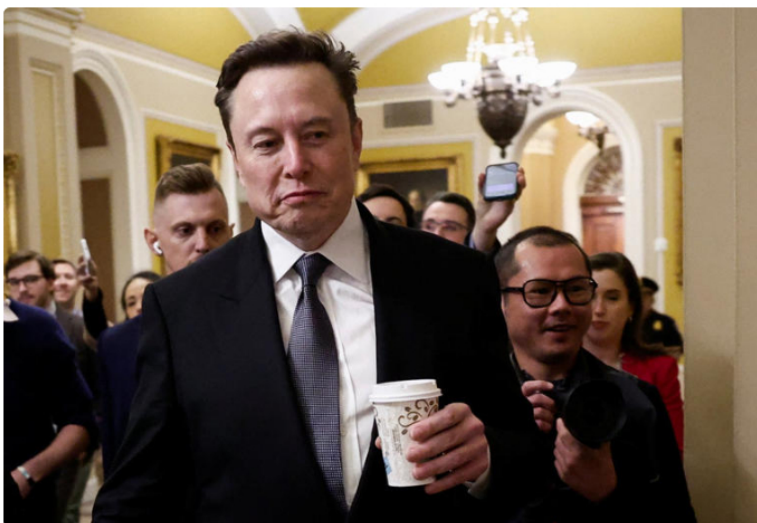
Members of US Congress meet with Musk and Ramaswamy on Trump's government efficiency plan

Elon Musk arremetió contra el líder de la minoría demócrata en la Cámara de Representantes de EE. UU., Hakeem Jeffries, después de que el proyecto de ley de gastos del Congreso en el que había insistido, que incluía una suspensión del límite de deuda y la eliminación de una serie de concesiones a la oposición, fracasara en la Cámara de Representantes el jueves por la noche, dejando al Gobierno estadounidense al borde de un colapso federal.