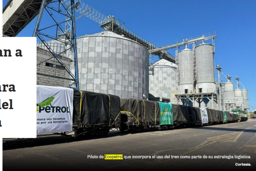
Piloto de Ecopetrol que incorpora el uso del tren como parte de su estrategia logística.