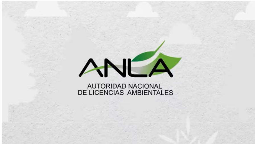
La institución dio luz verde al proyecto Komodo 1.

Redacción Nación 19 de diciembre de 2024