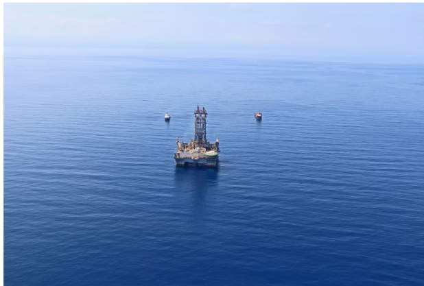
Los proyectos buscan aumentar la capacidad de gas de la nación.

Las principales preocupaciones del Gobierno Nacional se relacionaban con las repercusiones que el proyecto le podría generar al medio ambiente de la zona donde se realizarían las perforaciones, razón por lo cual pidió una serie de estudios que lograrán determinar las implicaciones que el mismo generaría.