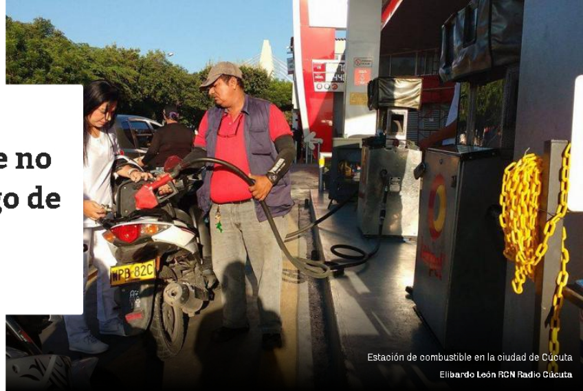
Estación de combustible en la ciudad de Cúcuta Elibardo León RCN Radio Cúcuta