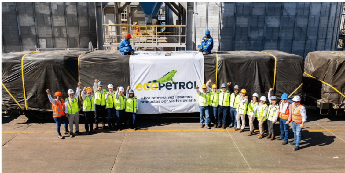
PETROQUÍMICOS DE ECOPETROL ARRIBAN AL PUERTO DE SANTA MARTA VÍA FÉRREA