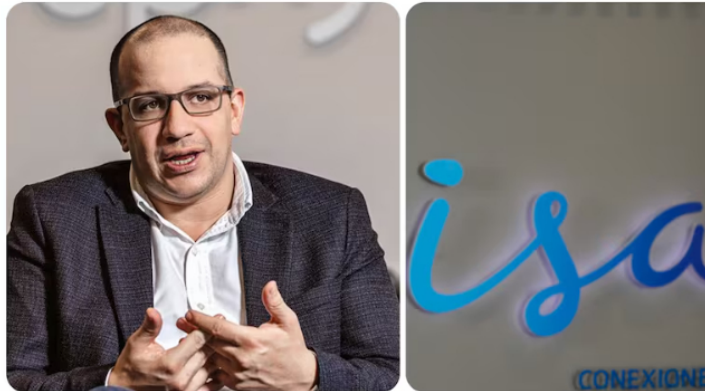
Jorge Carrillo, presidente de ISA

Redacción Economía 16 de diciembre de 2024