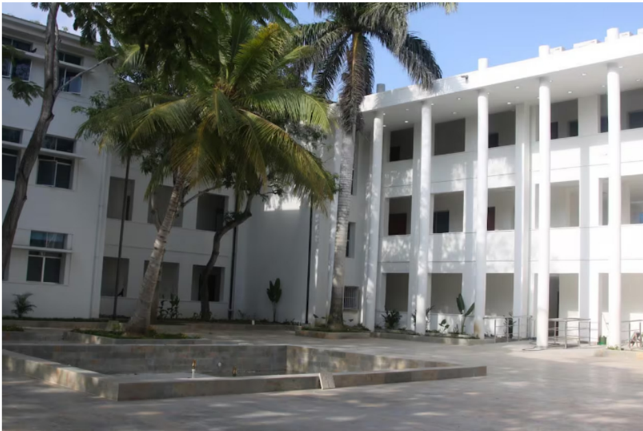
El Consejo de Estado definirá el pleito entre la Universidad de Cartagena y Ecopetro .

Contexto: Estudiantes de la Universidad de Cartagena denuncian casos de violencia de género en la Facultad de Derecho