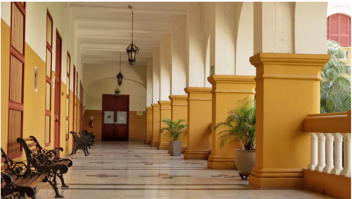
Instalaciones de la Universidad de Cartagena.

Redacción Nación 14 de diciembre de 2024