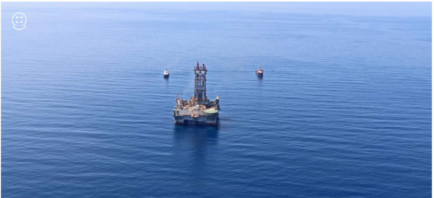
Pozo Sirius-2 de Ecopetrol y Petrobras

La decisión de que sea Santa Marta y no Riohacha, es porque no existe puerto con garantías mínimas.