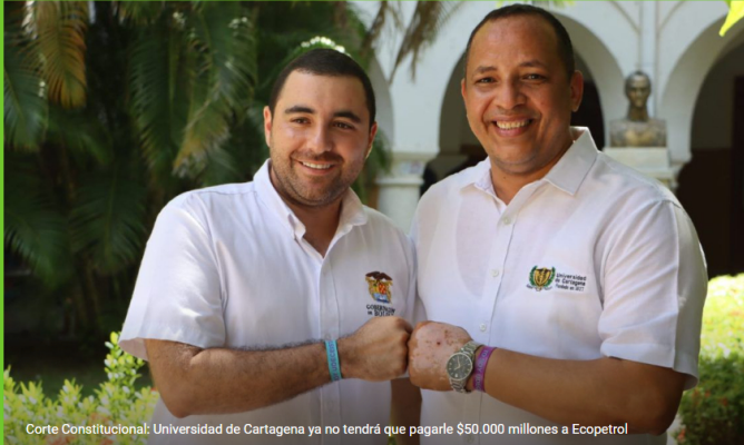
Corte Constitucional: Universidad de Cartagena ya no tendrá que pagarle $50.000 millones a Ecopetrol

Inicio / 2024 / diciembre / 13 / Corte Constitucional: Universidad de Cartagena ya no tendrá que pagarle $50.000 millones a Ecopetrol