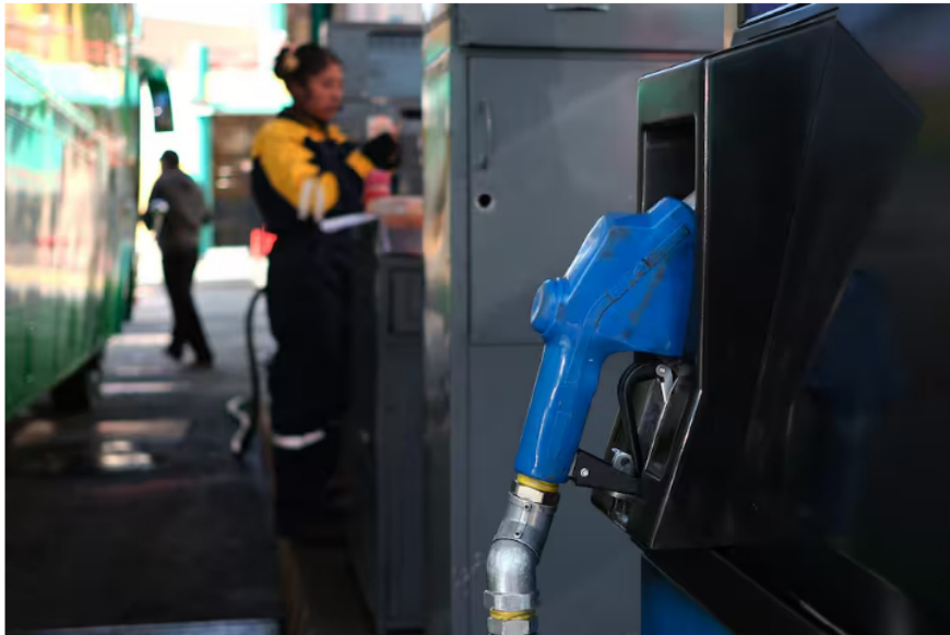
A finales de 2022, el saldo total adeudado a Ecopetrol por parte del FEPC ascendía a $36,8 billones.