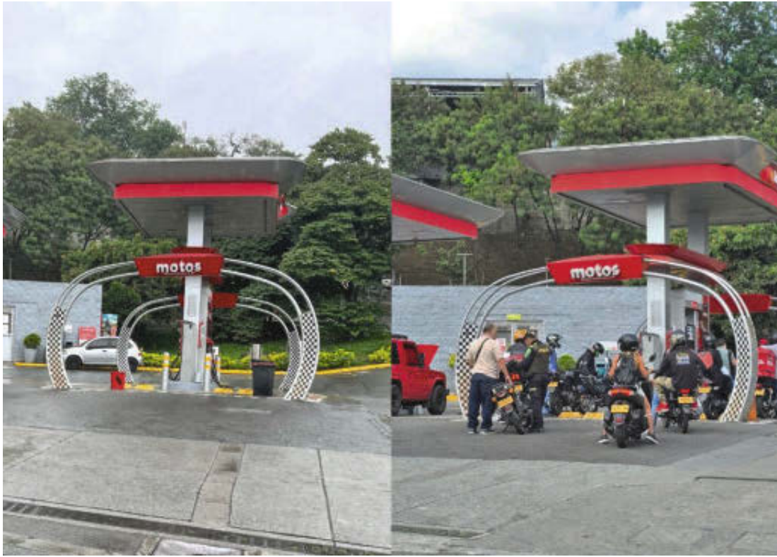
Así lucía la estación de gasolina de la Feria de Ganado en la mañana del martes ante la escasez de combustible (izq.) y en la mañana de ayer (der.) con la normalización.