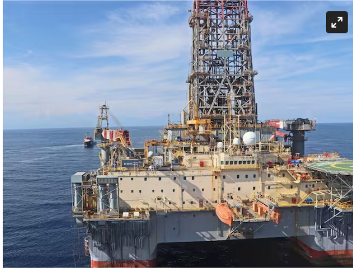
Plataforma pozo Sirius-2. Ecopetrol