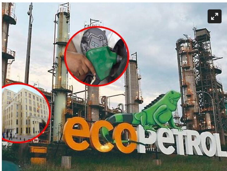
Ecopetrol confirma pago por 2.8 billones de pesos, correspondientes al 100% de la cuenta por cobrar al Fondo de Estabilización de Precios de los Combustibles (FEPC) del cuarto trimestre de 2023.

El pago, hecho el 28 de noviembre, fue por 2.8 billones de pesos, correspondientes al Fondo de Estabilización de Precios de los Combustibles del cuarto trimestre de 2023.