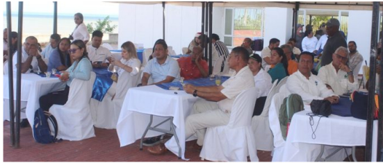
Los comunicadores de Riohacha reunidos con Hocol y Ecopetrol la mañana de este miércoles 11 de diciembre.