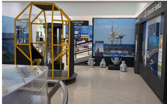
Sala étnica interactiva y museo del gas.