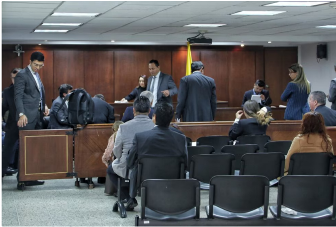
Por el caso Reficar, los implicados fueron sancionados por la Contraloría General de la República

El tribunal también criticó los cálculos de la Contraloría, indicando que no demostraban que la junta directiva hubiera incurrido en acciones que provocaran el descalabro del proyecto. Además, el fallo destacó que las adiciones presupuestarias respondieron a necesidades técnicas y no a intenciones maliciosas por parte de Gómez Restrepo u otros ejecutivos.