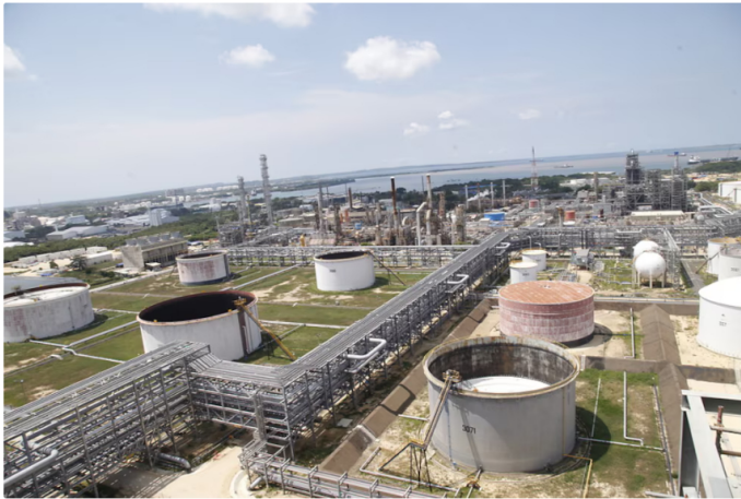
El tribunal aseguró que la Contraloría hizo mal los cálculos sobre el supuesto detrimento patrimonial

Tres años después de que la Contraloría General de República anunciara al país sobre las duras sanciones contra algunos exdirectivos de la Refinería de Cartagena (Reficar) por cuenta del detrimento patrimonial de casi tres billones de pesos durante su proyecto de ampliación, en la mañana de este martes 10 de diciembre se conoció un nuevo fallo que anularía la decisión del ente de control.