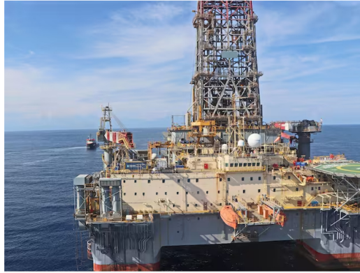
Plataforma pozo Sirius-2. Ecopetrol