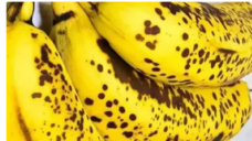
DiaformRX Quienes tienen diabetes, léanlo - ¡Antes de que lo borren!