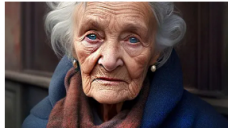
Colgazeta La fecha de muerte depende de la de nacimiento: mire sus números