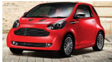
Buscar Anuncios Los jubilados podrán comprar estos coches eléctricos, ver precio