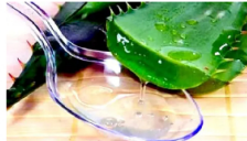
Focus Clear ¡Vista perfecta en 9 días! Receta antigua que realmente funciona