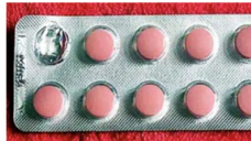
Hipertension Esta pastilla olvidada limpia las venas a un ritmo impresionante