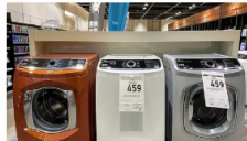
Search Ads ¡Las lavadoras no vendidas se pueden comprar casi gratis!