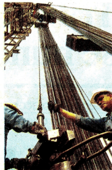
Extracción crecería con nuevos trabajos de exploración y producción.

Acopi puso sobre la mesa una tercera propuesta del 5,2%, que no fue acogida por los empresarios, pero que para el Mintrabajo sirve para tener un piso en la negociación. ¶