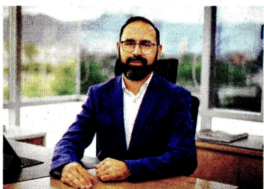
Ministerio de Minas y Energía

En medio de la alerta de la operadora del Sistema Interconectado Nacional XM por los bajos niveles de los embalses en el país, y el abastecimiento de energía, el precio promedio ponderado de la energía en bolsa se disparó por encima de los $850 por kWh. Al 30 de marzo, el precio del kilovatio por hora (kWh) se ubicó en un promedio de $763,4/kWh, mientras que el precio ideal máximo que se tenía previsto era de $830,79/kWh. Pero, el jueves de Semana Santa, el valor promedio de la electricidad en bolsas llegó a superar los $850 por kWh hasta los $857. Ante este panorama, el Ministerio de Minas y Energía prepara dos resoluciones para garantizar la generación de energía térmica en el país. "Sacamos un mecanismo de contratación bilateral", indicó el ministro Andrés Camacho . (MM)