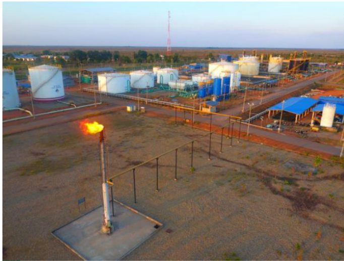
Campo Ocelote, de Hocol, en Puerto Gaitán (Meta).

Según la filial de Ecopetrol esto se hace con el fin de cumplir con el objetivo de asegurar el abastecimiento continuo durante el año 2025.