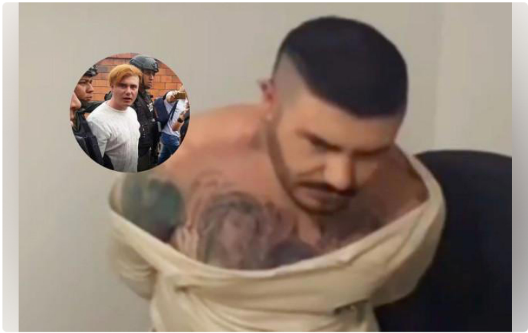
El cambio físico de alias 'Pichi' El cambio físico de alias 'Pichi'

Historia de Carlos López · 5 h · 1 minutos de lectura