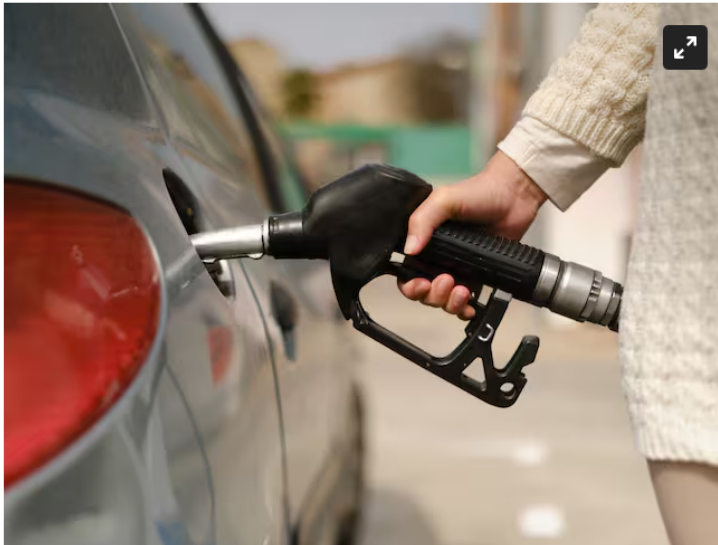
Mujer poniendo gasolina a su carro

Mientras que la empresa Terpel indicó que la situación se reporta por situaciones ajenas a ella y si por demoras en la entrega de producto a la Planta La María.