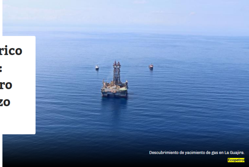
Descubrimiento de yacimiento de gas en La Guajira.