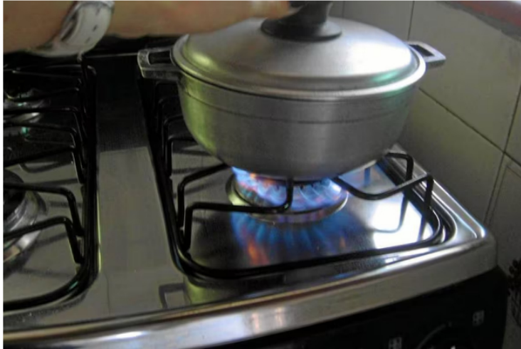
Alertan por pérdida de autosuficiencia en gas y alza en facturas para 2025.

Compartir La Asociación Colombiana de Ingenieros de Petróleos, Energía y Tecnologías Afines (Acipet) advirtió que el país está perdiendo su autosuficiencia en gas natural, una situación que obligará a recurrir a importaciones desde 2025 para abastecer hogares, industrias y transporte.