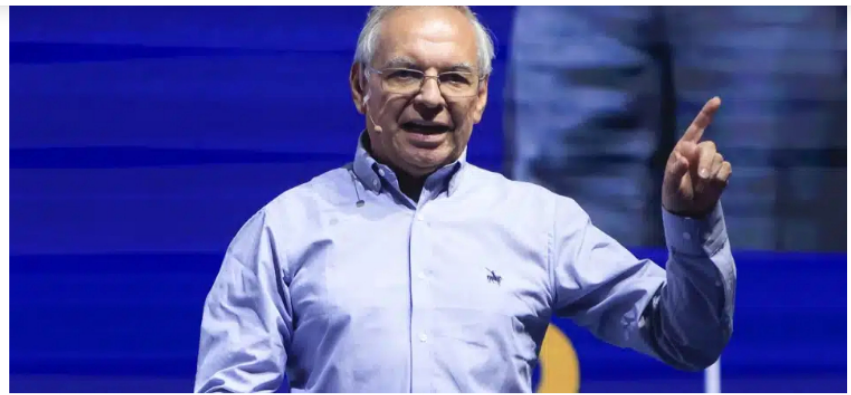
Resultan llamativos los términos de la renuncia de Bonilla.

Este sitio web utiliza cookies. Si continúa utilizando este sitio web, está dando su consentimiento para que se utilicen cookies. Visite nuestra Políticas de Privacidad . Acepto