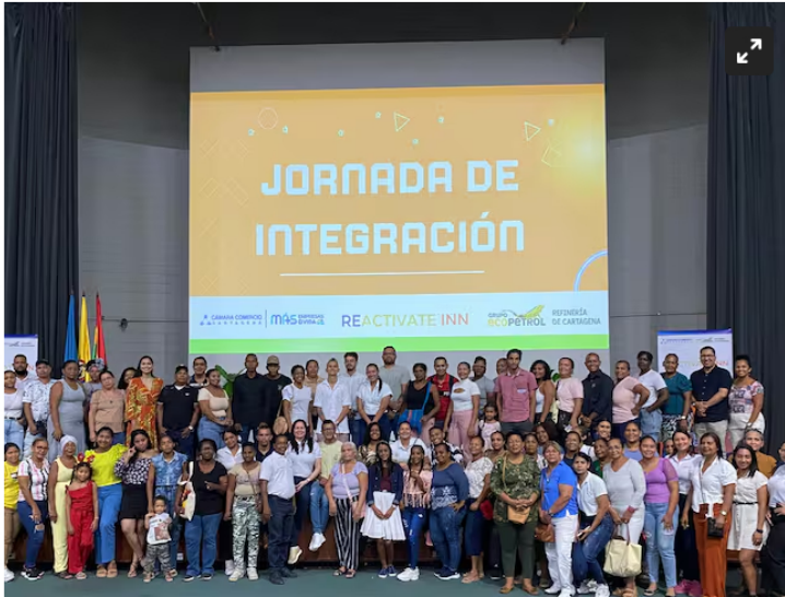
Reactivate Inn para impulsar el crecimiento de más de 442 microempresarios

Cámara de Comercio de Cartagena y Ecopetrol lideran la iniciativa