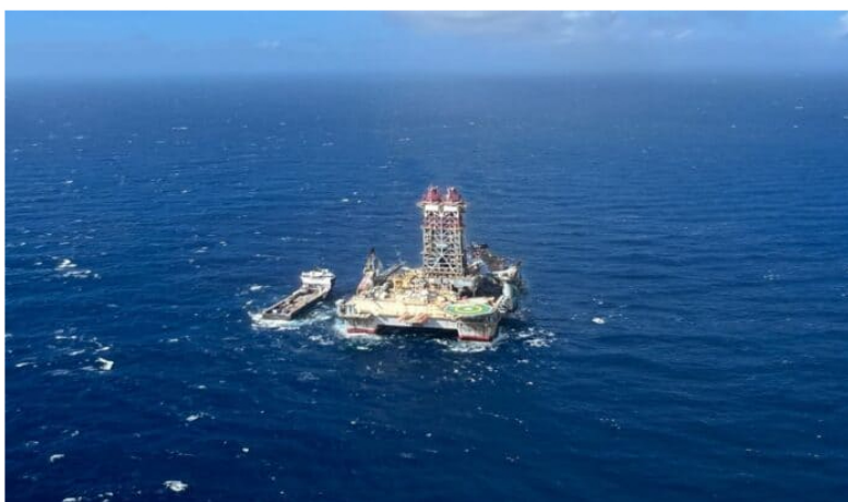
Las nuevas perforaciones que subirán reservas de gas de Ecopetrol y Petrobras en offshore de Colombia.

El presidente de Ecopetrol, Ricardo Roa Barragán, entregó detalles de lo que viene para la petrolera, en asocio con Petrobras, para seguir aumentando las reservas de gas natural en Colombia desarrollando el potencial del offshore (costa afuera) en el Bloque Gua-Off-0 (antes Bloque Tayrona).