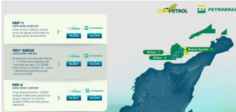
Las nuevas perforaciones que subirán reservas de gas de Ecopetrol y Petrobras en offshore de Colombia

Hay que decir que el pozo Buena Suerte 1 se perforará en 2025 y tendrá la misión de evaluar el alto estructural con mayor área de la Cuenca Guajira Offshore – Subcuenca Nazareth. Como se sabe, Ecopetrol tendrá una participación del 55,56 % y Petrobras de 44,44 %, este último siendo la empresa operadora.