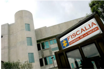
Fiscalía con la mira en varios concejales de Bogotá