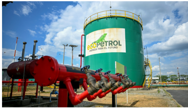
Vista frontal de instalaciones de Ecopetrol en Acacias, Colombia, el 11 de febrero de 2024

Las petroleras Petrobras y Ecopetrol confirmaron el "mayor descubrimiento de gas de la historia de Colombia", en un área marítima cercana a Santa Martha.