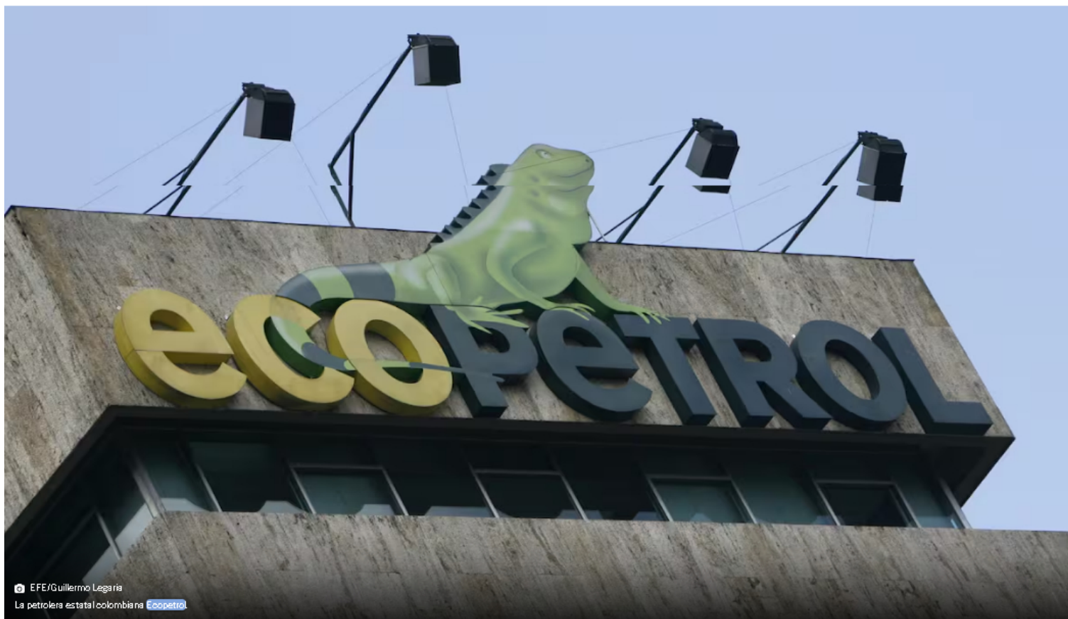
La petrolera estatal colombiana Ecopetrol