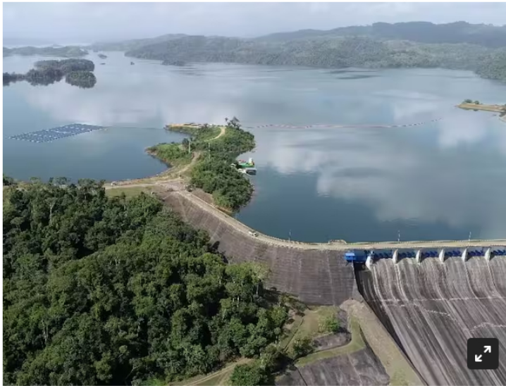
Hidroeléctrica de Urrá.

El jefe de la cartera de Hacienda, Ricardo Bonilla, afirmó que la Fiscalía tendrá que averiguar quiénes son los involucrados de las irregularidades en la Hidroeléctrica Urrá.