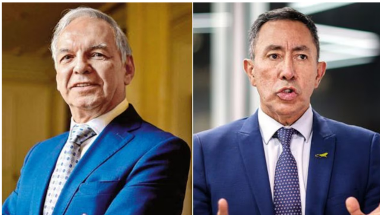
De izquierda a derecha: ministro de Hacienda, Ricardo Bonilla, y presidente de Ecopetrol , Ricardo Roa.

La denuncia interpuesta por el ministro de Hacienda, Ricardo Bonilla, contra el presidente de Ecopetrol , Ricardo Roa, y Nicolás Alcocer, por supuestas injerencias en la hidroeléctrica Urrá, suscitó nuevas críticas de la oposición al Gobierno de Gustavo Petro.