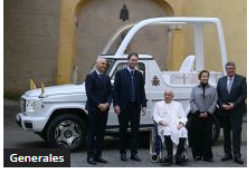
Papa Francisco recibió el primer papamóvil totalmente eléctrico