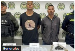
Judicializados dos hombres por presuntos actos de terrorismo en colegio de Soledad, Atlántico