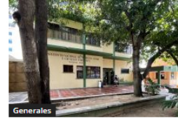
Hombre fue asesinado en el barrio Manuela Beltrán de Soledad