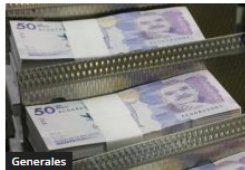
Piden revisión de cifras del Dane en medio de la discusión del salario mínimo para 2025