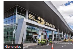
Siguen las tensiones en Migración Colombia por incumplimientos laborales