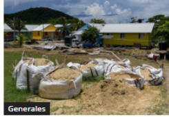
«Reconstrucción» de Providencia: Promesas que naufragan en un mar de irregularidades