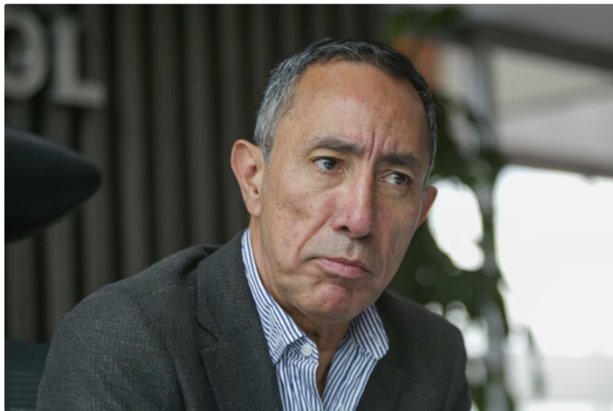
Roa afirma que su pareja no ha firmado contratos con la compañía petrolera