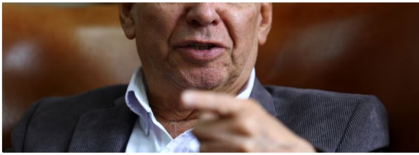
Ricardo Bonilla, ministro de Hacienda y Crédito Público de Colombia

Además, se indica que la empresa Power China habría sido favorecida en diversos contratos estatales relacionados con el sector energético en Colombia. Por tal motivo, el denunciante explicó que estos presuntos favorecimientos deben ser objeto de investigación.